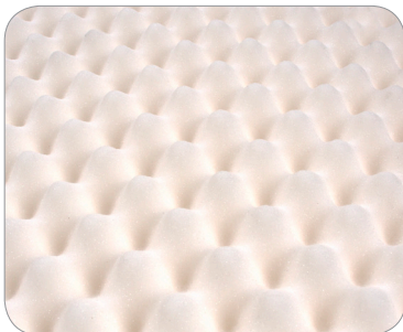
Noppenstruktur wirkt Wärmestau entgegen