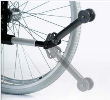
Sicherheitsrad schwenk- und anpassbar.