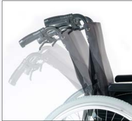
RubiX Recline-Rücken (stufenlos bis 30°).