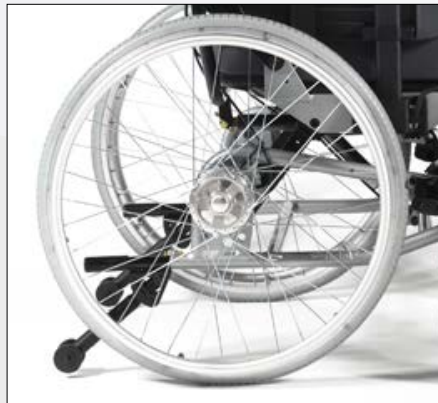
Trommelbremse für Begleitpersonen.