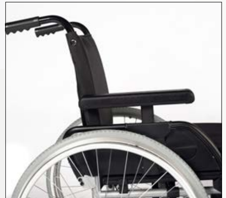
Höhenverstellbares Seitenteil mit Armauflage lang oder kurz, variabel anpassbar.