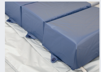
einzel entnehmbare Polyurethan-Zellen

Ohne Randzonenverstärkung würde die Matratze bei Belastung unkontrolliert in ihrer Form nachgeben.