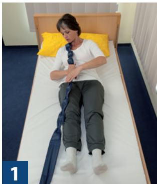
Bettzüge ohne Unterstützung