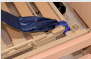
Bettzüge mit glatten Zwischenräumen