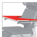
Tisch mit Polsterauflage