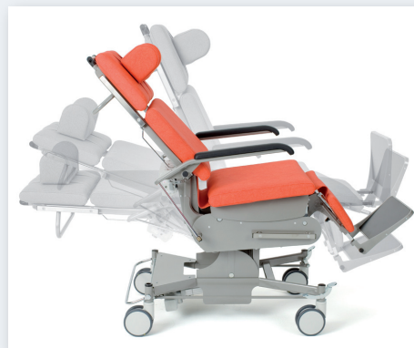
Stufenlose elektromotorische Verstellung mittels Handschalter

Moderner Akkubetrieb – volle Funktionalität und zukunftsfähiges Sicherheitsniveau ohne Netzkabel