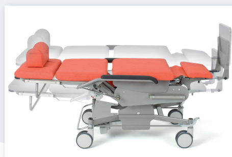
Höhenverstellung in jeder Sitz- und Liegeposition