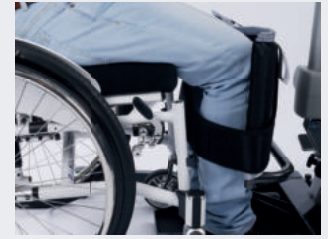
optionales SLK Wadenband